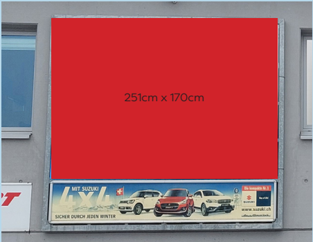
Grosse Werbe­fläche Talstation