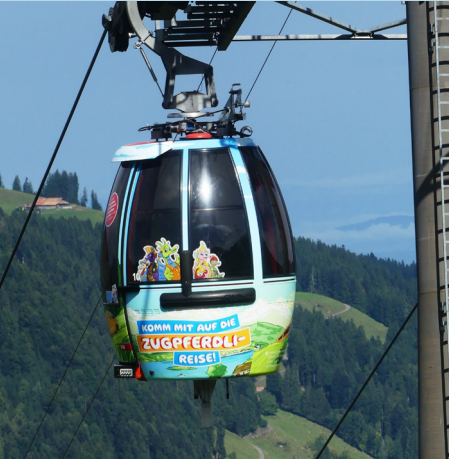
Vollflächiges Branding Gondel